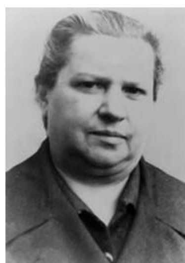
Policejní foto 1942